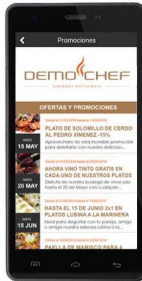
Ofertas y promociones