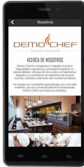
Información y contacto