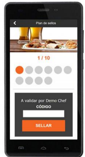
Sellos de fidelización